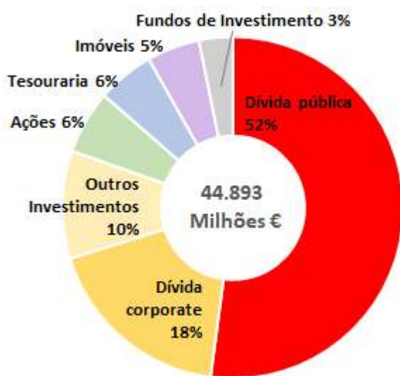
Distribuição por Tipo de Ativos